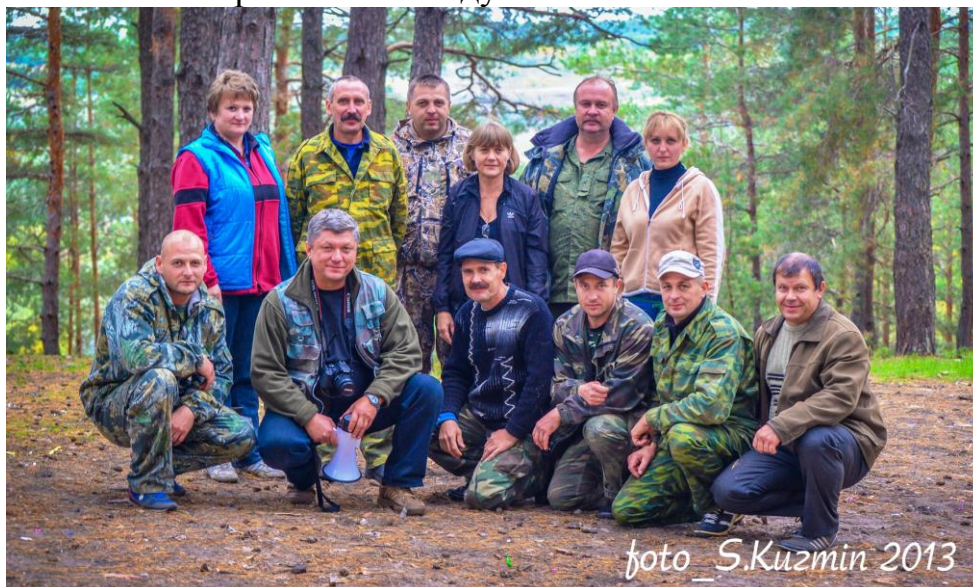
Главная судейская коллегия игры

В настоящее время военно-патриотическая игра «Славянка» проводится коллективом Муниципального бюджетного образовательного учреждения дополнительного образования «Инжавинский районный центр дополнительного образования «Радуга»